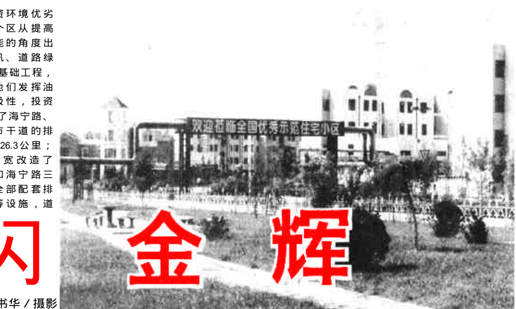
韩荣华 / 撰文

金辉 功在当代、利在千秋的大事高度。区委书记王少飞、区长徐春福同分管的常务副区长孙学孟以及区六大班子领导，不但多次到工程现场进行现场办公，还对活动中出现的难点问题如资金协调、建筑物拆迁等问题专门召开调度会议和专题会议。他们立足现实、放眼长远、认真调研、采取有效措施，大大鼓舞了全区建设系统的干部职工不怕苦、不怕难，连续作战，奋勇争先，使“九八城建年”活动开展得卓有成效，城区建设日新月异，有了长足发展。 基础设施是城市的骨架和城市功能的载体、城市配套服务功能的高低是城市投资环境优劣的直接表现。这个区从提高城市综合服务功能的角度出发，把道路、防汛、道路绿化等工作列入城市基础工程，认真组织实施。他们发挥油田和地方两个积极性，投资3000余万元，完成了海宁路、河滨路等主要城市干道的排水设施建设工程26.3公里；投资1934.9万元拓宽改造了海盛路、河滨路和海宁路三条城区道路，并全部配套排水、绿化、路灯等设施，道