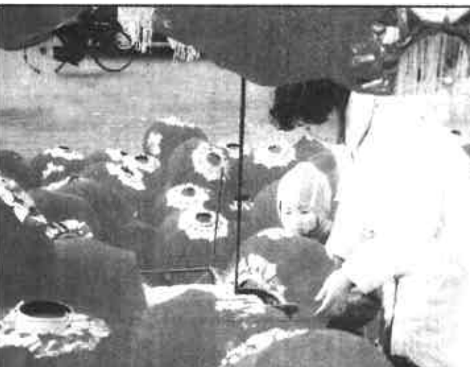
买个灯笼好过年

压岁钱的风俗可以追溯到春秋时期。那时，是在除夕夜，用彩绳将钱币穿起来，放置在床脚下，祈祷祝福后代平安无事，健康成长。压岁钱延续至今，作为民俗文化之一，既体现了中华民族尊老爱幼的传统美德，又给热闹的年夜饭增添了友爱祥和的气氛。特别是近些年来，人们的生活水平提高了，亲朋好友之间的礼尚往来日趋讲究，给孩子的压岁钱也就出手大方了。但是，做任何事情都应把握一个“尺度”问题，否则就会出现负面效应。